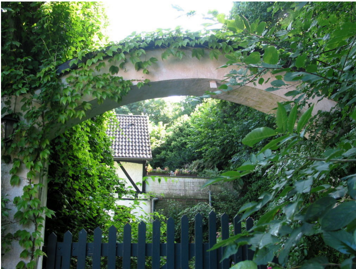
Gut Herrenhaus bei Mettmann (2012)