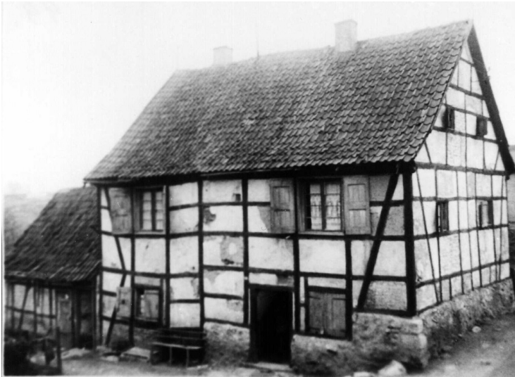
Historische Aufnahme der Kasteiner Mühle (um 1920)