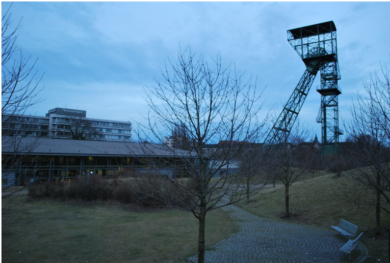
Fördergerüst Friedrich Thyssen 6 mit Rhein-Ruhr-Bad und Thyssengas Verwaltung in Duisburg - Alt-Hamborn (2013)