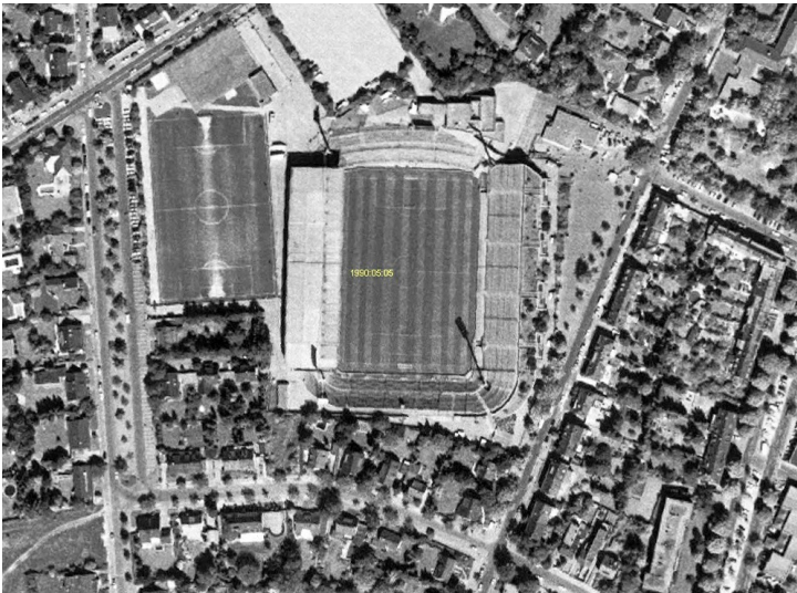
Das Gelände am Mönchengladbacher Bökelbergstadion auf einem Luftbild von 1990