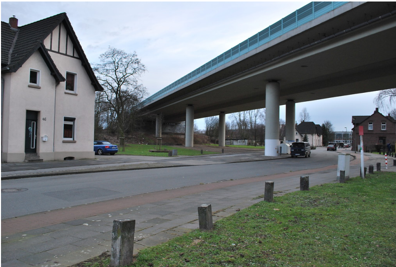
Alte Zinkhüttensiedlung in Duisburg-Marxloh (2013)