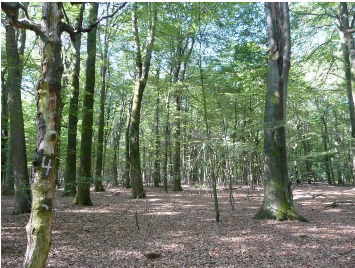
Das Bild zeigt einen Blick in die Naturwaldzelle Rehsol im Klever Reichswald (2010); zu sehen ist ein sehr ungleichaltriger Buchenwald mit Eiche und Birke.