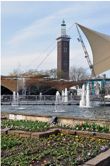
Springbrunnen des Tanzbrunnens mit den Schirmen von Frei Otto und dem Messturm im Hintergrund (2013)