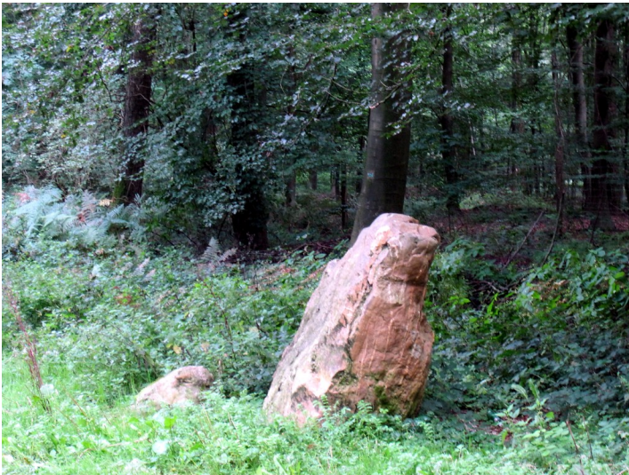
Findling "Goldenes Kalb" (Quarzitblock) im Reichswald bei Kleve (2011)