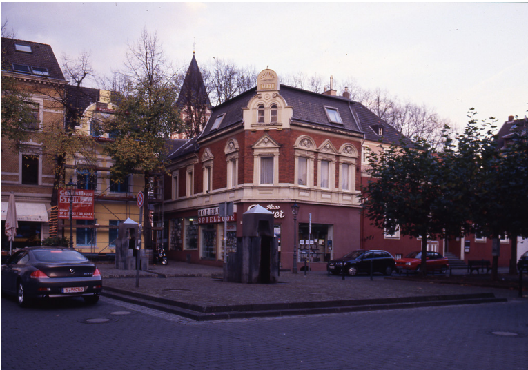
Denkmalbereich Düsseldorf-Gerresheim: Blick vom Alten Markt nach Norden, im Hintergrund die Turmspitze von St. Margareta (2008).