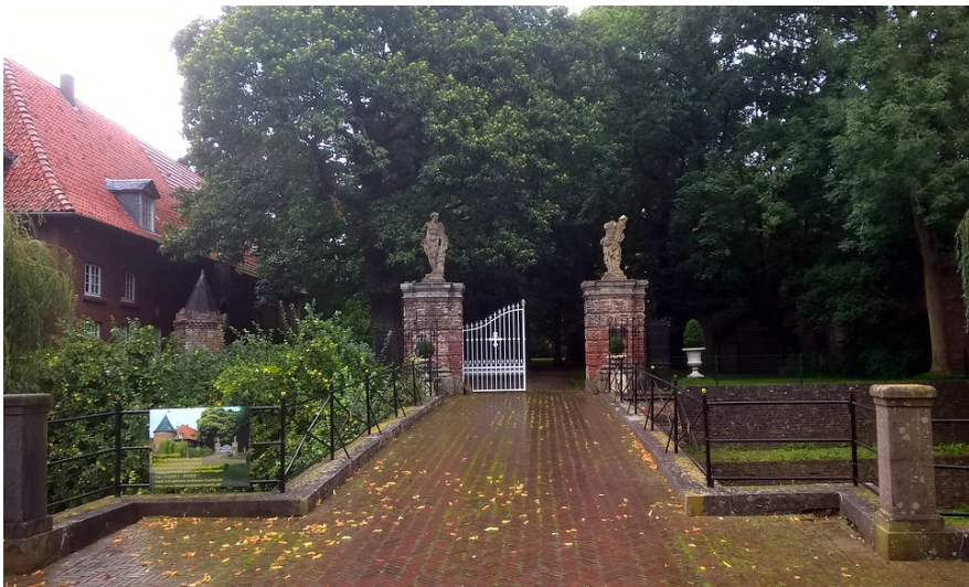
Eingangstor von Haus Hueth in Rees-Bienen (2015)