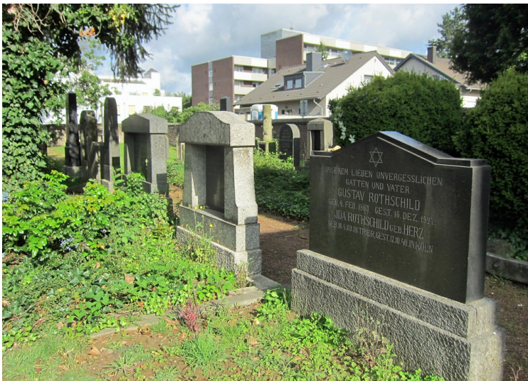
Grabsteine auf dem jüdischen Friedhof in der Grevenboicher Montanusstraße (2014).