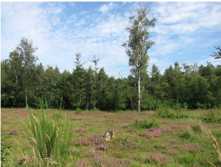
Heidefläche in der Ohligser Heide