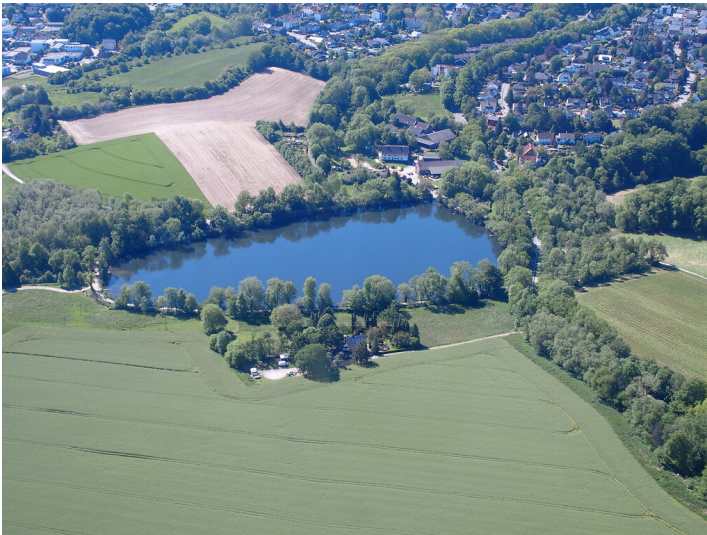
Abtskücher Teich (2021)