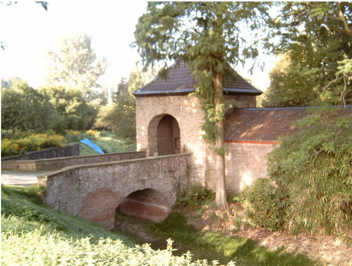
Zugangstor zu Haus Unterbach bei Erkrath (2006).