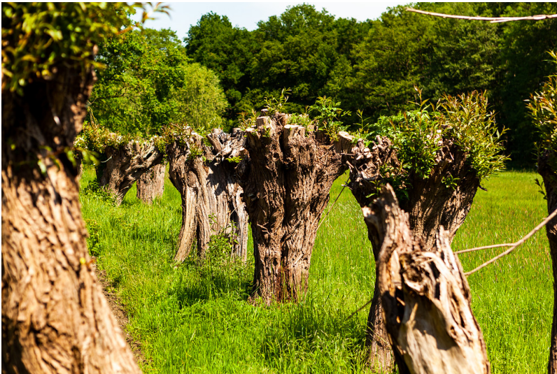
Beschnittene Kopfweiden am Landschaftshof Baerlo im Nettetal am Niederrhein (2018).