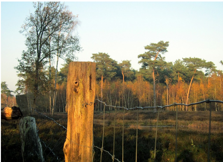
Heidelandschaft und Wald in der Dingdener Heide bei Hamminkeln im Kreis Wesel (2011).