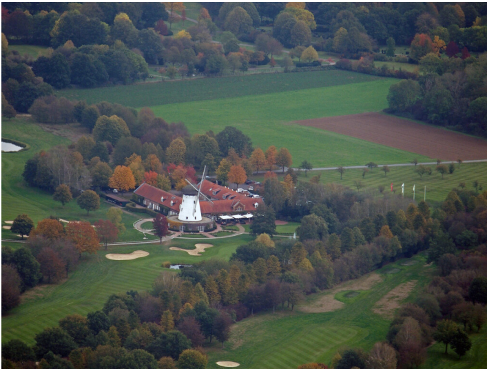
Elfrather Mühle in Krefeld (2020)