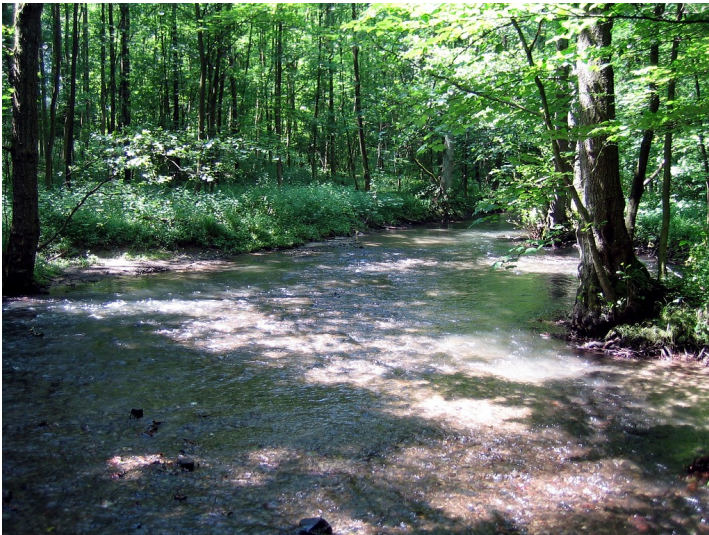
Der Fluss Düssel bei Mettmann (2006)