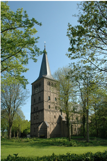
Sankt Vitus in Emmerich-Hochelten