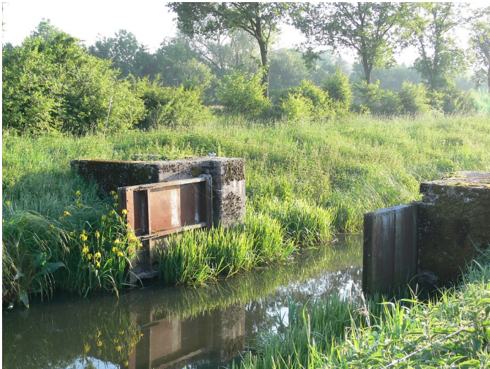
Historisches Wehr