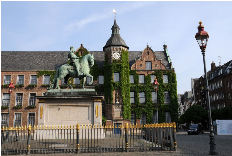
Jan-Wellem-Reiterdenkmal in der Düsseldorfer Altstadt