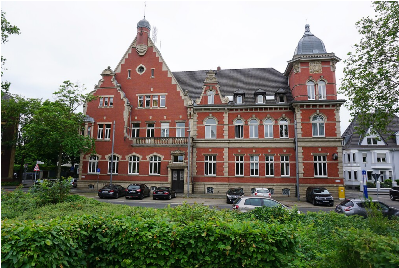
Viersen-Dülken, historischer Ortskern (2021). Altes Rathaus, Theodor-Frings-Allee