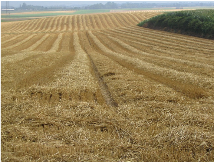
Stoppelfelder bei Kamphausen