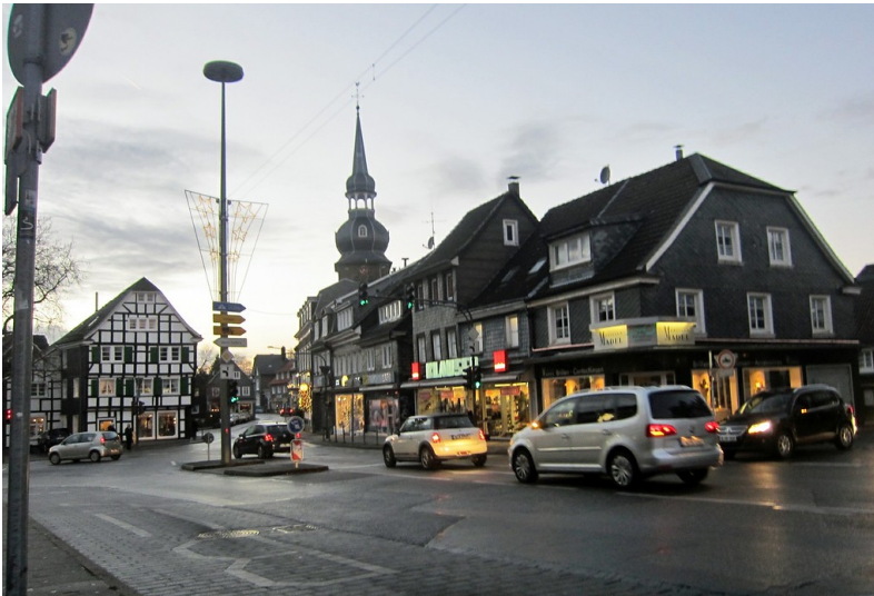
Abendlicher Ortskern am Hans-Otto-Bilstein-Platz in Wuppertal-Cronenberg (2014).