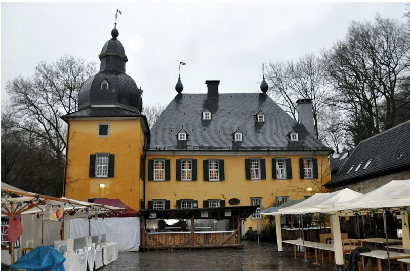
Das Schloss Lüntenbeck, die ehemalige Wasserburg Haus Lüntenbeck (2014).