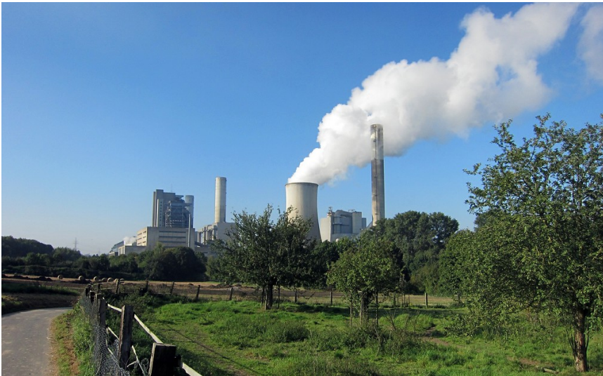
Das Braunkohlenkraftwerk Frimmersdorf I und II aus östlicher Richtung im Bereich Sandberg / Welchenberg (2014)