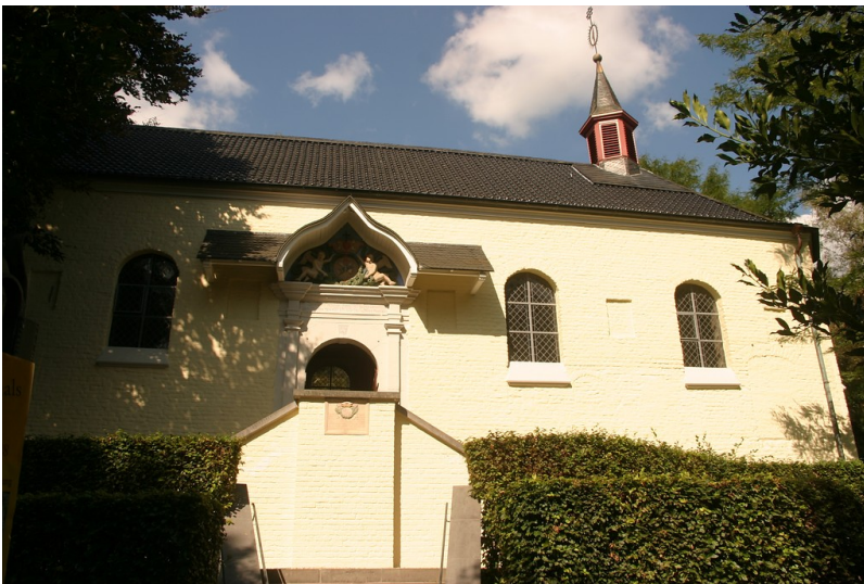
Kapelle Klein-Jerusalem