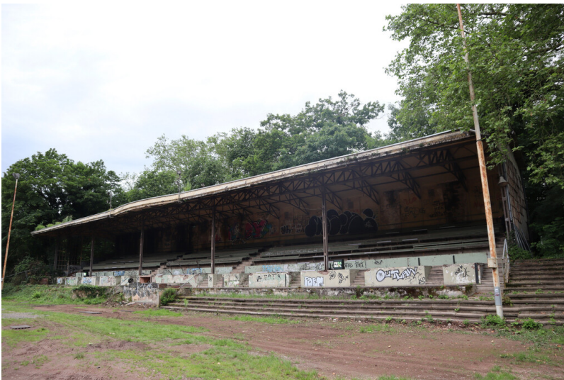
Die Tribüne des Stadions an der Rennbahn Weidenpescher Park in Köln (2024). Der fortschreitende Verfall des denkmalgeschützten Bauwerks ist deutlich sichtbar.