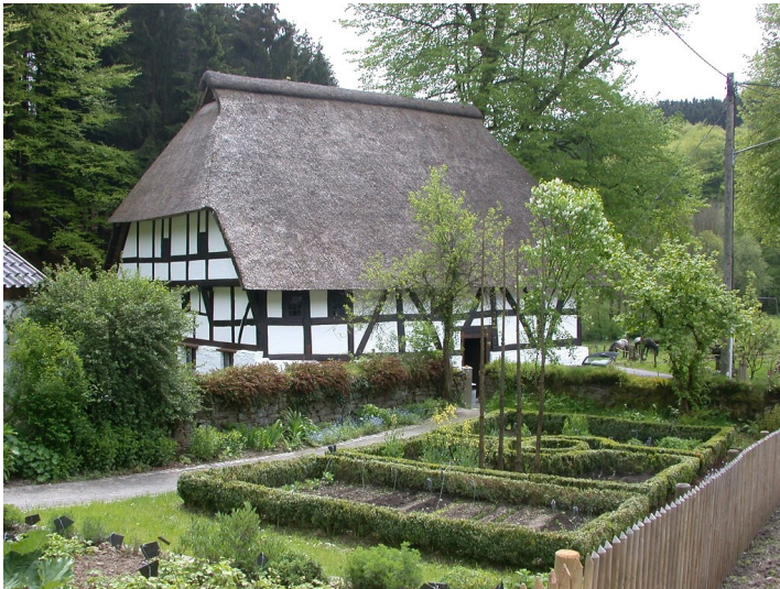
Museum Haus Dahl mit historischem Bauerngarten