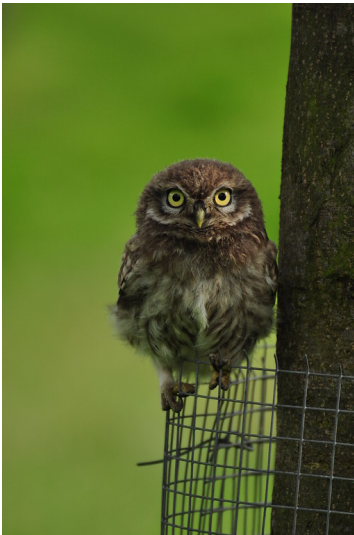
Ein auf einem als Verbissschutz dienenden Drahtgeflecht sitzender Steinkauz, aufgenommen bei Kleve (2012).