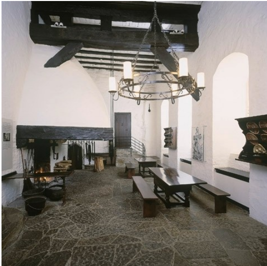
Die historische Burgküche von Schloss Homburg (2013).