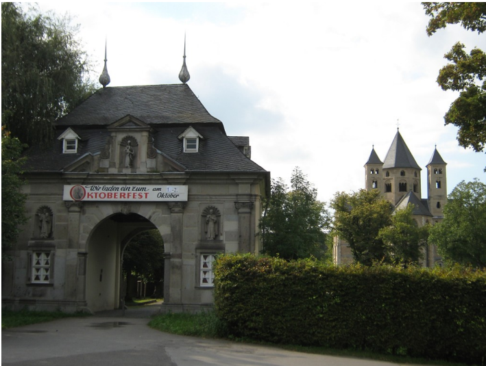
Torhaus und Basilika Kloster Knechtsteden