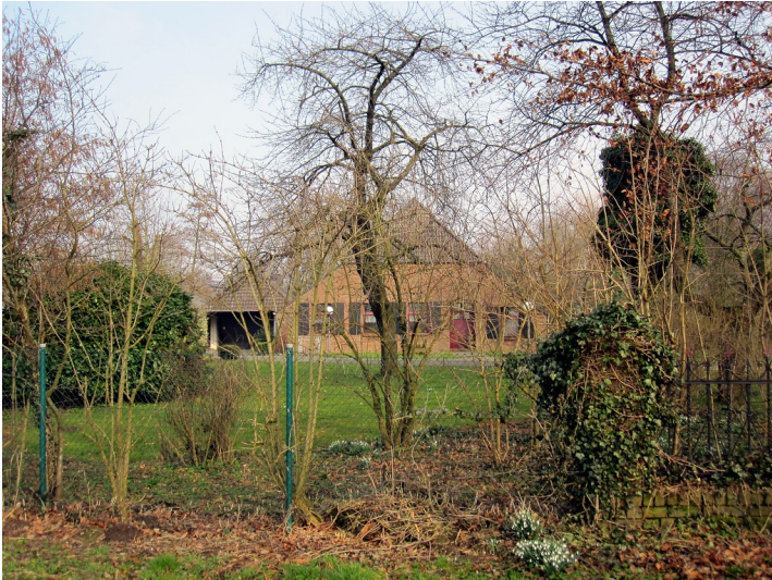
Gehöft an der Uedemerbrucher Straße südlich von Uedemerbruch (2011)