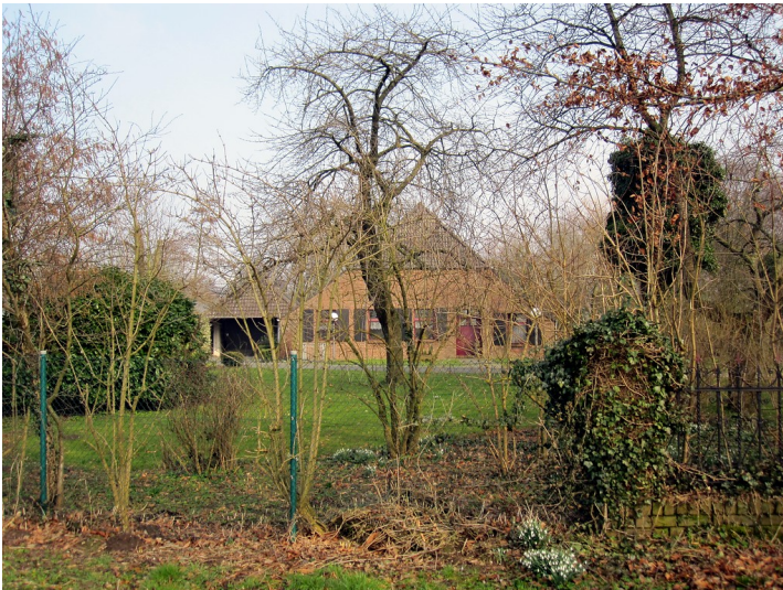
Gehöft an der Uedemerbrucher Straße südlich von Uedemerbruch (2011)