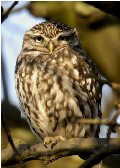
Steinkauz in einem Obstbaum sitzend