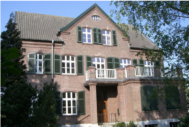
Gebäude des Naturschutzzentrums im Kreis Kleve in Rees-Bienen (2007)