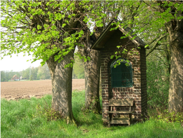
Heiligenhäuschen - ein typisches Element im Kendel- und Donkenland