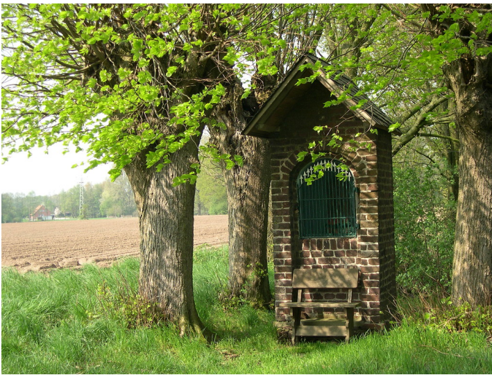
Heiligenhäuschen - ein typisches Element im Kendel- und Donkenland