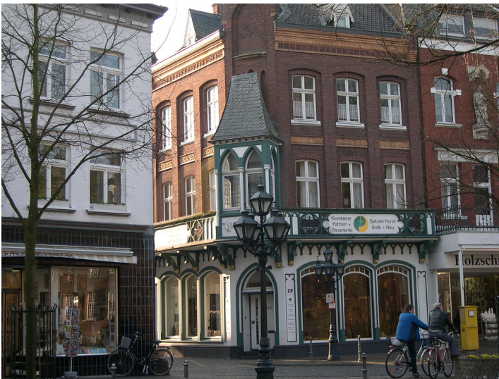
Historische Fassaden in Kevelaer