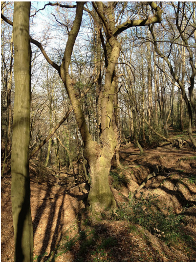
Durchgewachsene, ungepflegte Kopfeiche am Schleifenweg in Königswinter im März 2012