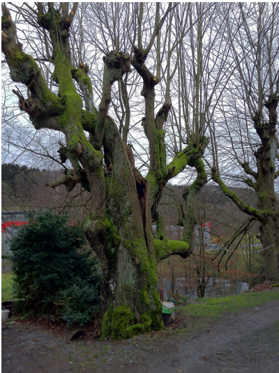
Gruppe geschneitelter Hoflinden bei Kürten (2012)