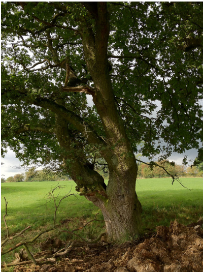
Durchgewachsene, ungepflegte Kopfeiche im Grünland am Herzogsweg in Aachen-Laurensberg (2012)