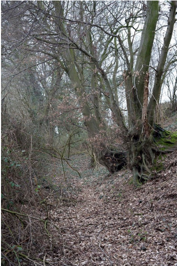
Hohlweg am Dufhaussteg (Rheurdt) mit geschneitelten Buchen in den Hangflanken (2012)