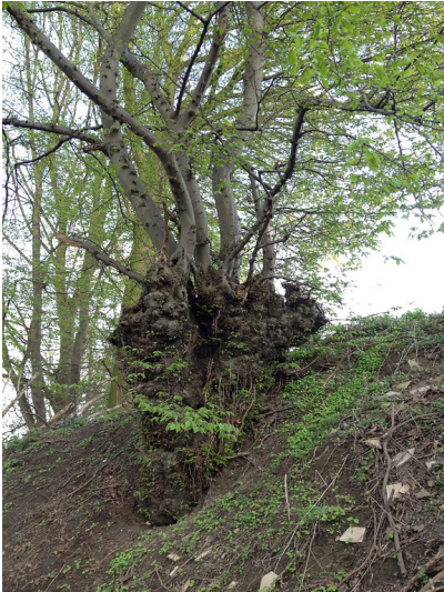
Kopfbaum am Hufelsweg in Rheurdt (2012)