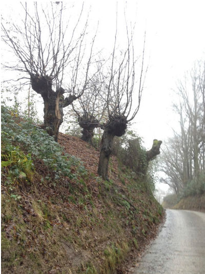
Kopfbäume, Eschen und Stieleichen am Vogtsweg in Rheurdt (2011)