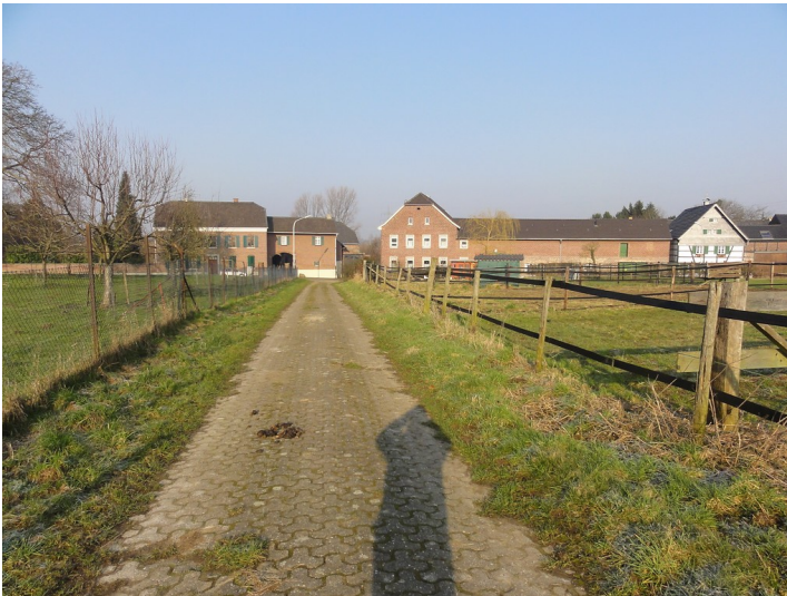
Hoflage in Jüchen-Herberath