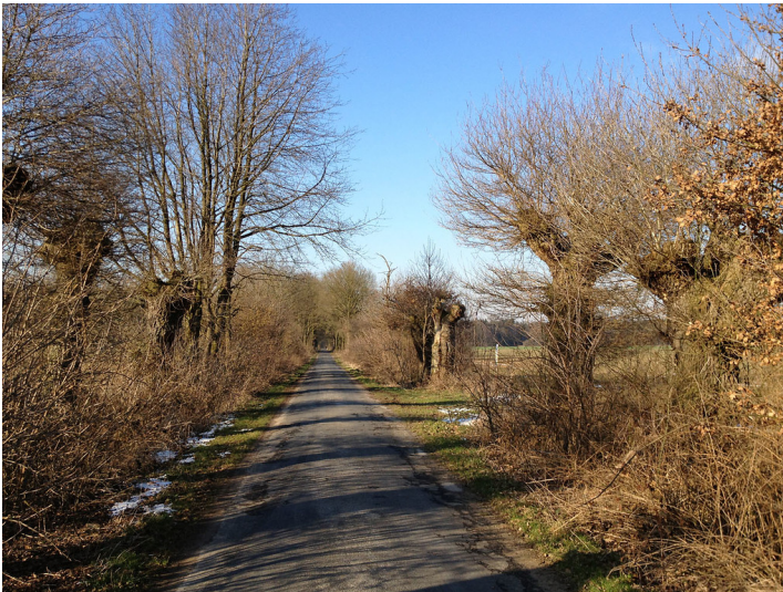
Kopfeichenallee südlich der historischen Schlossanlage Calbeck in Weeze neben der Niers (2013)