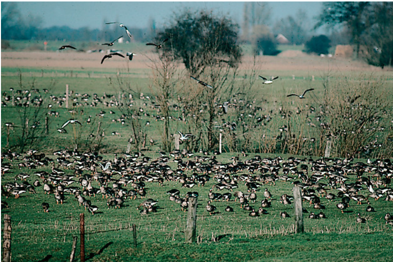
Vogelrast bei Millingen aan de Rijn