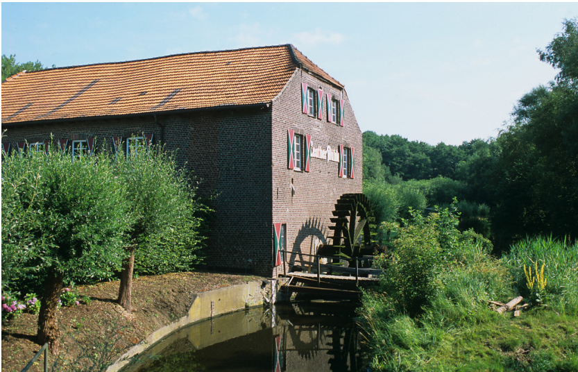
Leuther Mühle