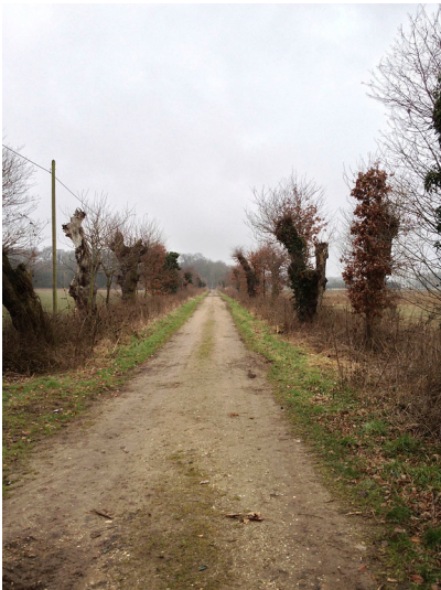
Kopfeichenallee Ossenbrucher Weg in Wassenberg-Birgelen (2013)