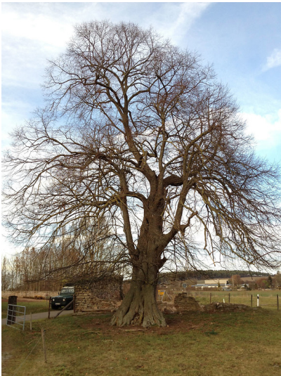
Hoflinde bei Burg Heistard in Mechernich (2012)