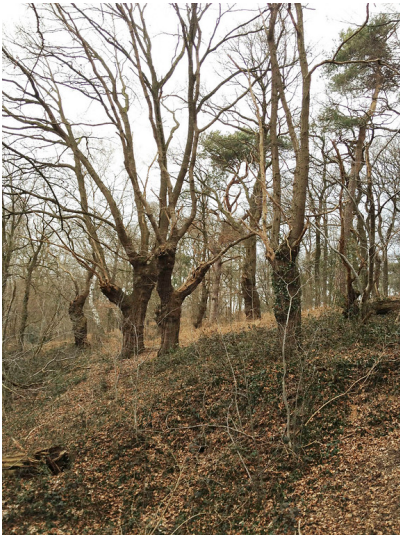
Kopfeichen am südlichen Rand des Waldgebietes der Leucht bei Issum (2012)